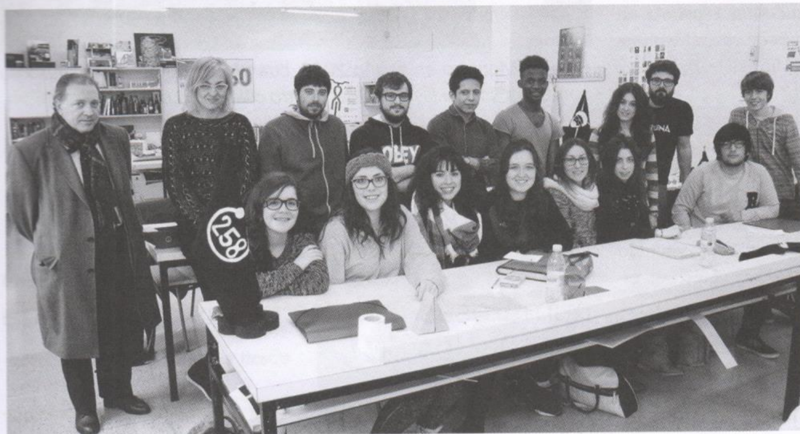
Los alumnos de la primera promoción de los Estudios Superiores de Diseño en Corella

Un grupo de 14 alumnos son los pioneros de los Estudios Superiores de Diseño que se imparten desde este curso