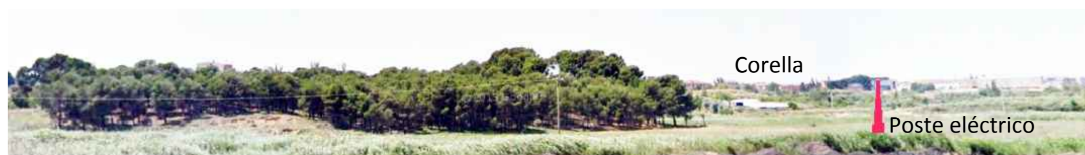
Localización de la caja refugio